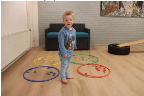
Kinderdagverblijf, peuterarrangement en BSO:

Het kinderdagverblijf en peuterarrangement is, samen met de buitenschoolse opvang (BSO), onderdeel van Kanteel Kinderopvang te 's-Hertogenbosch. De basisschool, het kinderdagverblijf, peuterarrangement en BSO vormen samen één team om vanuit één gedachte en één visie de inhoudelijke doorgaande ontwikkelingslijn voor kinderen van 0-13 jaar vorm te geven.